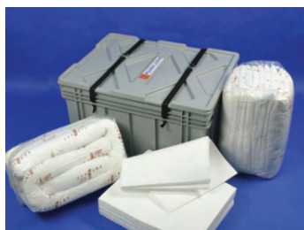
Ref.: KIT 200

Bolsa intervención rápida de 50 x 45 x 15 cm.