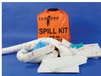
Ref.: KIT 30

Unidades polivalentes con diferentes capacidades de absorción y múltiples aplicaciones en la industria, transporte o servicios de emergencia. Contienen varios formatos de absorbentes, en los tipos OIL R y CHEM , de fácil y rápida manipulación. Están pensados para colocarlos en las distintas zonas donde exista peligro de derrame.